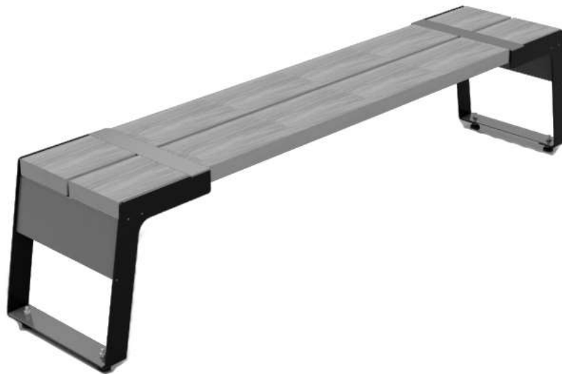
Bildet viser MOBIL benk i rustfritt stål og malmfuru

Produsent: Røros Produkter AS, 7374 Røros