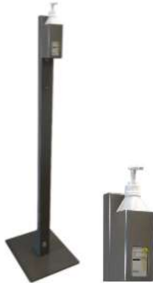
Dispenserstativ for manuell pumpeflaske 600ml