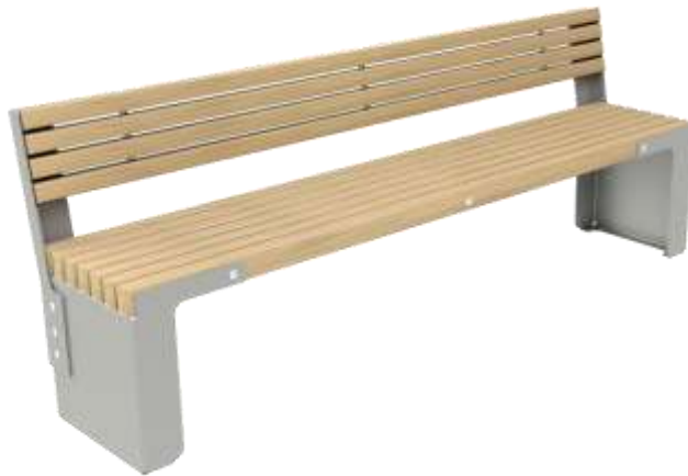
Bildet viser NOBEL benk med rygg i rustfritt stål og malmfuru

Produsent: Røros Produkter AS, 7374 Røros