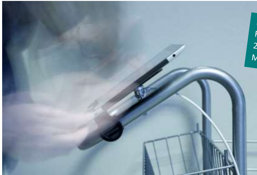
Bildet viser fastlåst nettbrett i holder montert på rengjøringsvogn

En fleksibel og låsbar nettbrett holder som forenkler hverdagen for renholderen. Nettbrettet bør sikres i forhold til tyveri, men være fleksibelt nok til at den lett kan tas ut for å brukes for fotografering eller annen dokumentasjon. Nå med stillbart anlegg slik at det lett kan tilpasses ulike tykkelser på nettbrettene. Leveres standard med sikkerhetswire med kodelås.